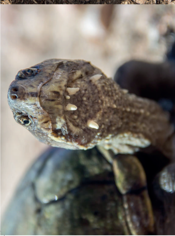
oben: Auffällig: Kinosternon sonoriense besitzt für Schlamm Schildkröten große Kinnbartel

Wie anpassungsfähig die Art ist zeigt die Höhenverbreitung der Populationen: Es werden hauptsächlich permanente Gewässer mit kiesigem oder sandigem Boden und klarem Wasser besiedelt, aber auch schlammige Viehtränken vom Flachland bis in über 2000m Seehöhe. Einer der bemerkenswertesten Fundorte ist „Montezuma Well“ in Zentral-Arizona. Dieser grundwasserspeiste Tümpel zeichnet sich durch seine konstante Temperatur von 21 °C und einem extrem hohen CO 2 -Gehalt im Wasser aus. Dies erzeugt für viele Pflanzen und kiematmen Organismen lebensfeindliche Bedingungen, denen die Schildkröten trotzen. Wenn die Temperaturen es ermöglichen, sind Sonora-Klappschildkröten ganzjährig aktiv. Dies trifft freilich eher für Flachlandpopulationen im südlicheren Verbreitungsgebiet zu-