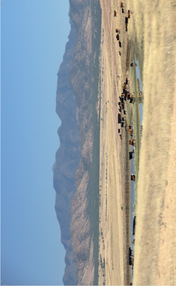
oben und rechte Seite: Die erste von uns besuchte Viehtränken im Great Basin Grassland