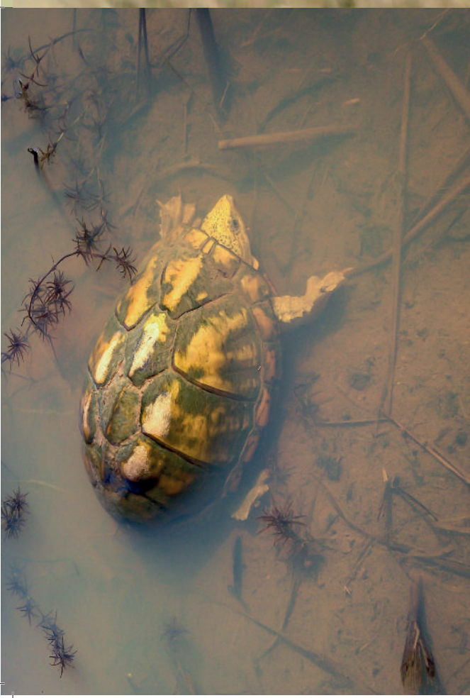
oben und rechte Seite: Kinosternon sonoriense mit starkem Flavismus , gefunden in einer Viehtränke im Great Basin Grassland.

allein in tieferen Kolken mit geringer Fließgeschwindigkeit. Hier ist der Fluss bis ca. 2 m tief und würde aufgrund des glasklaren Wassers zum Schnorcheln einladen, wäre da nicht die von uns gemessene Wassertemperatur von 13 °C. Der pH-Wert war 8,1 bei einem Leitwert von 350 µS/cm. Wegen der am Ufer wachsenden Bäume gibt es sonnigere und schattigere Flussabschnitte, außerdem sind Teile des Bodens mit Blättern bedeckt und es gibt immer wieder ins Wasser gefallene Äste. Die beobachtete Fischfauna umfasste eine nicht näher bestimmte Poeciliidenart, eine Art Chubfish und den Sonnenbarschverwandten Lepomis cyanellus . Auch hier konnten wir die eingeschleppten Lithobates catesbeianus nachweisen, sowohl als Larven als auch als beeindruckend großes adultes Exemplar. In einem stark verkrauteten, seichteren Bereich des Flusses fanden wir schließlich ein adultes Weibchen von Kinosternon sonoriense , das