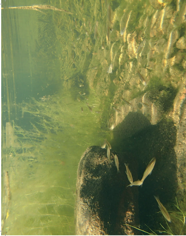
oben: Sonora Chubs in einem Bach im Sycamore Canyon rechte Seite oben: Sonora Chub, Gila ditaeia rechte Seite unten: selber Fundort: Tarahumara - Frosch