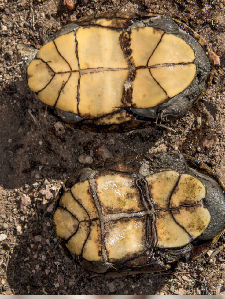
oben: Plastralansicht von K. sonoriense . Links Männchen, rechts Weibchen

den doch diese haben eventuell im Sommer mit maximalen Lufttemperaturen von bis zu 45 °C und kaum auftretenden Niederschlägen in der Gegend um Tucson zu kämpfen (Iten-Online 2016). Daher verlagern die Tiere oft ihr tagaktives Verhalten während des Winters über die heißen Sommermonate in die Nacht, wo sie mittels Taschenlampen am Boden der Gewässer auf Nahrungssuche beobachtet werden können (NIXON, pers. Mittlg.). Zwar bevorzugen K. sonoriense hauptsächlich permanente Gewässer wie Bäche und Tümpel, doch zeugen Funde in Viehtränken die über 8 km entfernt vom nächsten Gewässer liegen (DEGENHARD and CHRISTIANSEN 1974) von der Wanderfreudigkeit der Art. Auch Hibernation, bzw. Aestivation muss nicht direkt im Heimatgewässer stattfinden. Oft werden geschützte Stellen an Land aufgesucht.