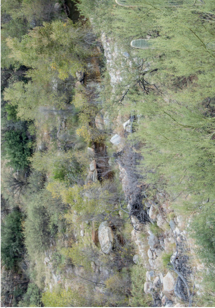
oben: Sabino Creek im Sabino Canyon in der Umgebung von Tucson, Arizona