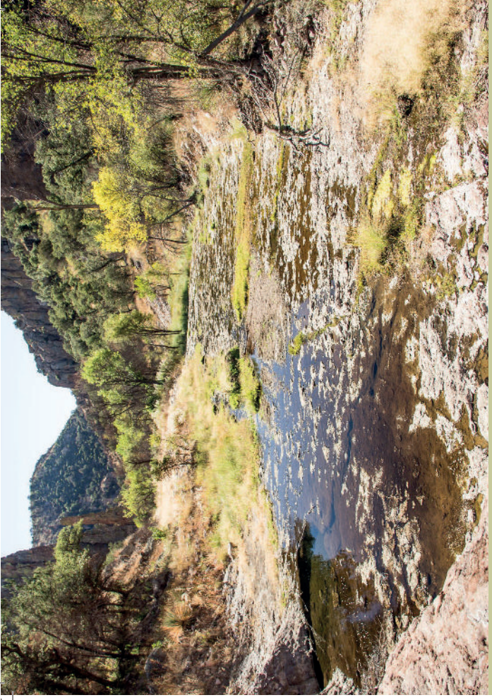
oben: Der Sycamore Creek durchfließt den Sycamore Canyon

Am Fuß dieses nach einer Platane benannten Canyons fließt ein kleiner Bach, der primär von aus dem Felsen austretendem Wasser gespeist wird. Normalerweise ist dieser Bach ca. einen bis 3 Meter breit und bis etwa maximal 1 m tief. Es gibt jedoch auch Stellen, wo der Bach deutlich breiter wird, dafür aber das Wasser einfach über blanken Felsen fließt und so flach ist, dass man mit normalen Sportschuhen darin gehen kann ohne nass zu werden. Folgt man dem Bach vom Ursprung aus weiter in die Berge hinein Richtung Süden, trifft man auf Kolke im Fels, die wesentlich tiefer sind. Im größten von uns besuchten mit etwa 50 m 2 Oberfläche und geschätzten 3 m Tiefe war es mir so-