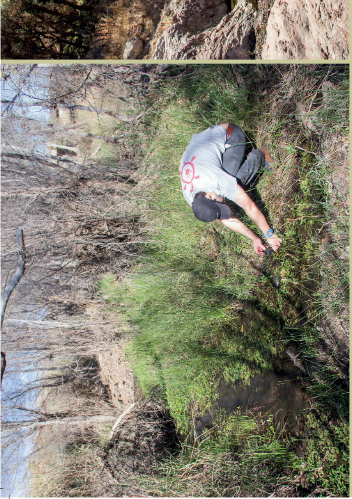
oben: Feldforscher unterwegs: Aufnahme von In-situ-Fotos

denen Sonora-Klappschildkröten vorkommen zu besuchen. Die Habitate befinden sich im größeren Umkreis von Tucson, Arizona und wurden mit dem Auto bereist. Soweit möglich, wurden Habitatparameter wie Lufttemperatur, Wassertemperatur, pH-Wert, Leitwert, umgebende Vegetation und assoziierte Faunenelemente aufgenommen. Weiters wurden GPS Koordinaten und Höhendaten registriert.