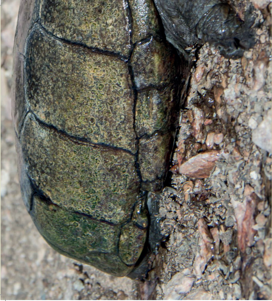
oben: Habitus von Kinosternon sonoriense

der Plastron oft aufhellen kann und gelblich gefärbt ist), weisen die Tiere am Kopf und in der Halsregion ein abwechslungsreiches gelbes Streifen- oder Punktmuster auf dunklem Hintergrund auf. Auffallend sind die vier bis fünf deutlich ausgeprägten Kinnbarteln, von denen (mindestens) zwei direkt am Unterkiefer und zwei deutlich weiter hinten in der Kehlgasse angeordnet sind. Neben der etwas kleineren Körpergröße unterscheiden sich die Männchen von den Weibchen durch einen konkaven Plastron, einem Hornmangel